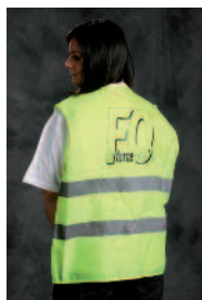
Gilet de sécurité Jaune ou orange 3,20€