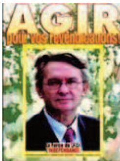
Agir ! Format 60x80cm 0,40€

FO Toutes les couleurs sont indispensables C'est + de diversité pour + d'égalité FO C'est + de diversité pour + d'égalité