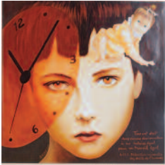
La course après le temps format 60x40cm 0,40€

La course après le temps L'heure, le travail, l'effort Le travail, l'effort, l'heure L'effort, l'heure, le travail L'obsession. FO