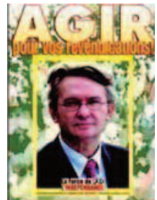
Agir ! Format 40x60 cm 0,20€