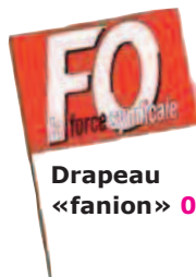
Drapeau «fanion» 0,60€