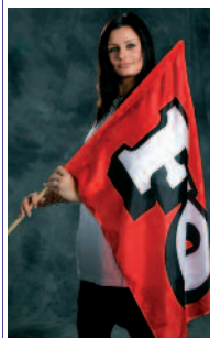
Drapeau flottant 4€